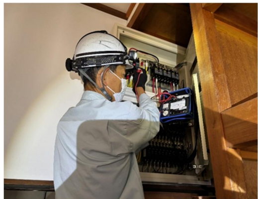
低圧絶縁抵抗測定